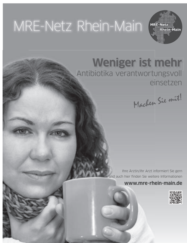
Abbildung 1: Plakate: „Weniger ist mehr – Antibiotika verantwortungsvoll einsetzen“

Kooperationspartner sind die Landesärztekammer Hessen, die Kassenärztliche Vereinigung Hessen, die Landesarbeitsgemeinschaft der MRE-Netzwerke Hessen und die drei anderen MRE-Netzwerke in Hessen, der Berufsverband der Hausärzte Hessen, der Berufsverband der Kinder- und Jugendärzte Hessen und der Berufsverband der Hals-Nasen-Ohren-Ärzte in Hessen, die Hessische Krankenhausgesellschaft und die Apothekerkammer Hessen.